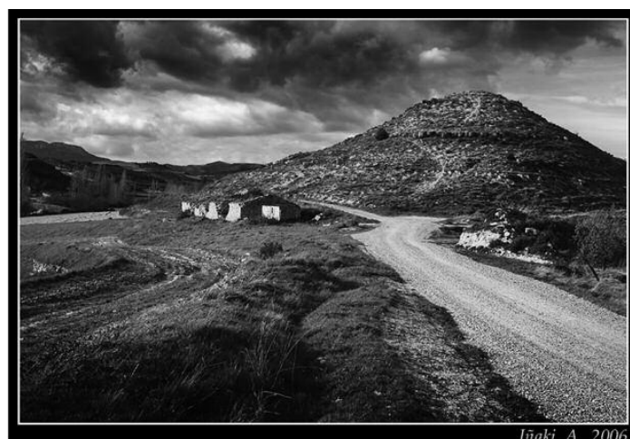
lūaki A. 2006

Dos datos importantes: la Cuaresma fue tiempo de preparación intensiva de adultos, para bautizarse en la Vigilia Pascual. También constituyó un momento decisivo de calidad testimonial para los "pecadores públicos", (los que habían cometido graves pecados y estaban excluidos de la comunión), y se preparaban para la reconciliación en la celebración comunitaria de la penitencia durante la mañana del Jueves Santo.